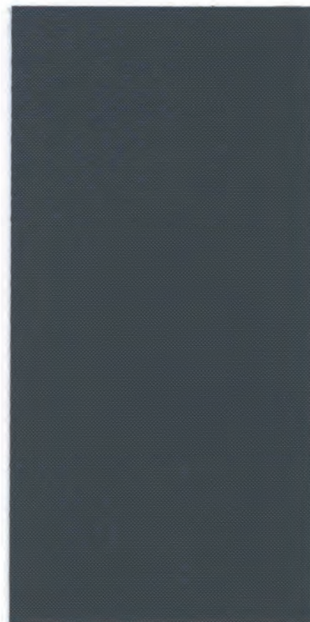
782782 Anthracite Gray