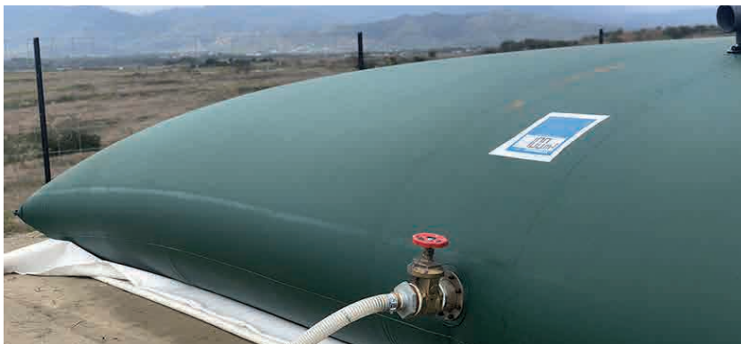
article 5206 – colour 737

Мобильные контейнеры, резервуары и бассейны позволяют быстрое развертывание и гибкое применение для различных задач. Идёт ли речь о временном хранении экологически опасных химических веществ, масел и нефти, или о бережном хранении питьевой воды и пищевых продуктов, всегда можно подобрать решение из нашего ассортимента тканей со специальными покрытиями. Эти линейки продуктов характеризуются длительным сроком службы и хорошей устойчивостью к воздействию хранимых сред.