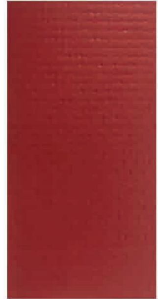
article 4516 – colour 348