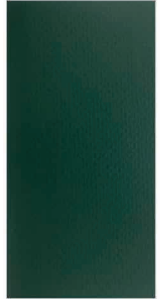
article 5211 – colour 679